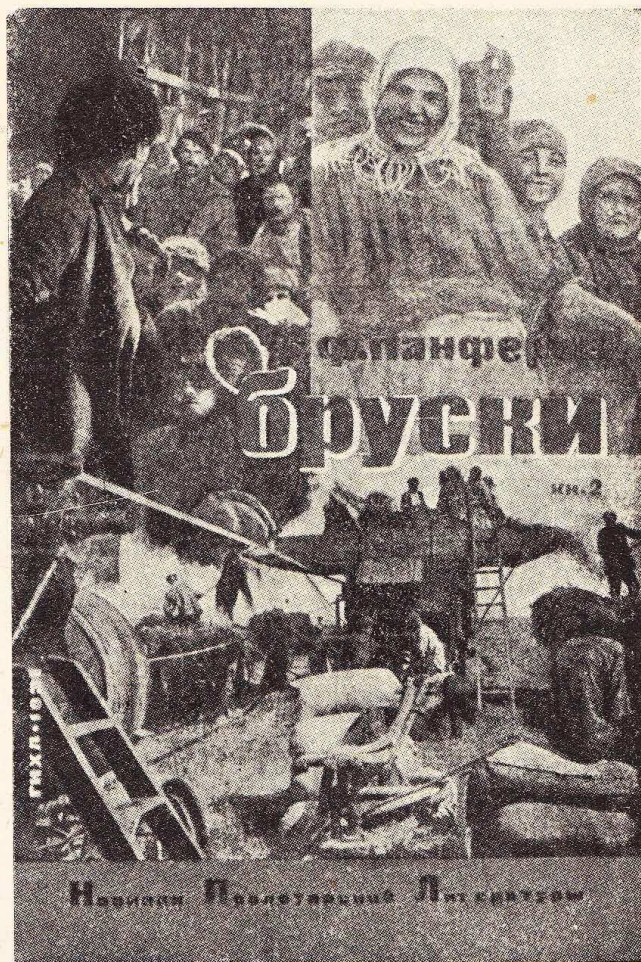
Обложка графической части ГИХЛа

Некоторые слабости художественной отделки повести покрываются крайне острой постановкой проблемы, поднятой автором.