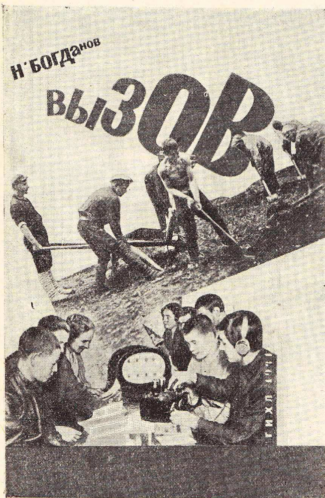
Обложка худ. А. Щербакова